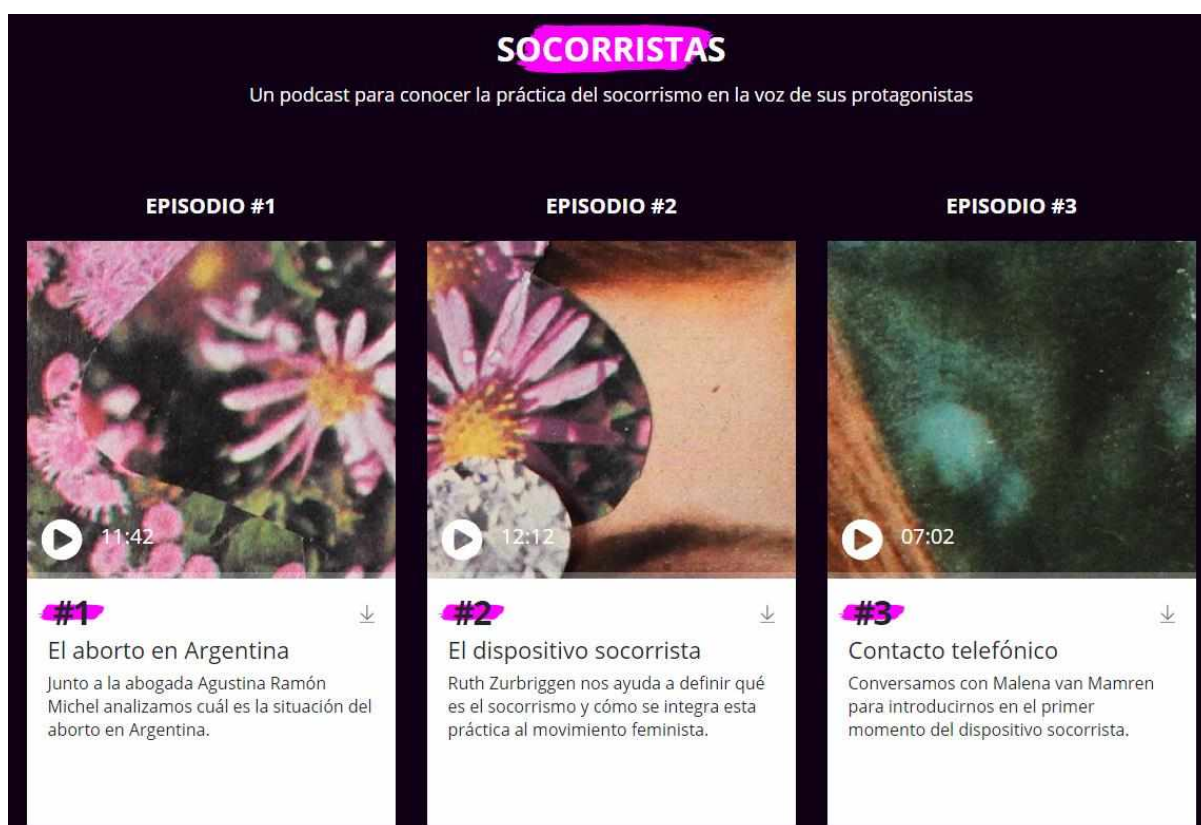
Figura 1. Captura de pantalla de la serie de podcast a través de los cuales se reconstruye el “dispositivo socorrista”.

Sororas es un documental web basado en los testimonios de las mujeres que le ponen el cuerpo a esta problemática. A través de entrevistas a las activistas feministas que ayudan a sus pares reconstruye “el dispositivo socorrista”, la metodología desplegada por las socorristas que consta de cuatro etapas: el llamado de socorro inicial, los encuentros grupales cara a cara en los que las mujeres reciben información recomendada por la Organización Mundial de la Salud, el acompañamiento telefónico durante el proceso de aborto y los controles médicos posteriores; reconociendo las motivaciones y significaciones políticas de esta práctica 4 .