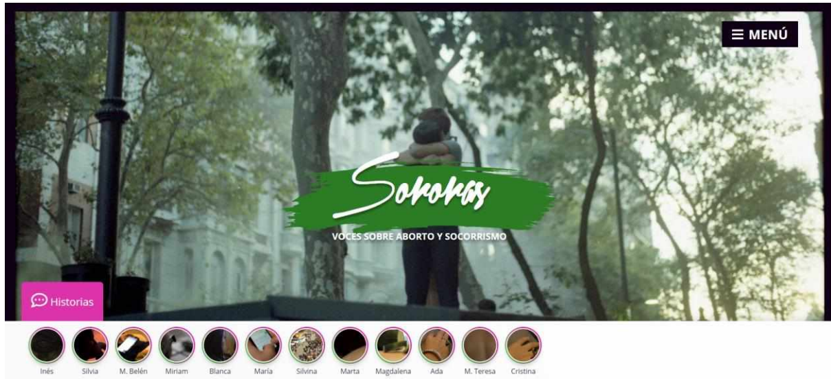
Figura 2. Captura de pantalla de los testimonios de mujeres que abortaron con ayuda de activistas socorristas.

por la organización Socorristas en Red, las palabras de mujeres anónimas tejen un entramado de historias colectivas signadas por la violencia, la soledad, el amor y la desesperación.